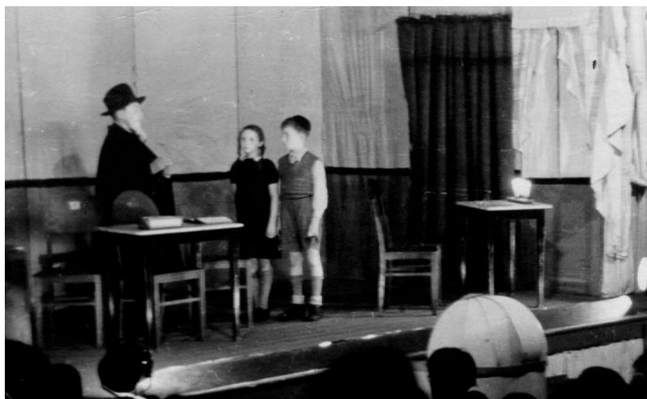
הצגה לחנוכה במחנה וסטרבורק – הולנד

נשאלנו על ידי מפקד המחנה: "למי שייכת חליפה זו, בה היה לבוש הצרפתי?.. שייגש הנה. אחד אחרי השני עברנו מול הצרפתי. כשאני התקרבת אליו, זיהיתי בוודאות כי זאת חליפתי היקרה, בצבע לבן-אפרפר, מברלין. לא היה טעם להתכחש, כי בפנים הכיס השמאלי היה רקום שמי, כך שבלאו הכי היו מגיעים אלי. הודיתי איפוא כי היא שייכת לי. - "איך מגיעה חליפתך אל הצרפתי?" – שואלי אותי מפקד המחנה, ואני עונה: - "אינני יודע, אני מסרתי אותה, בשעתו, למחסן הבגדים!" - הצבע על מי שקיבלת ממנו את החליפה!" – פוקד המפקד על הצרפתי. והלה עובר מיהודי ליהודי, ואינו מזהה – או לא רוצה לזהות – אף אחד. מה היה גורלו של הצרפתי הבורה אינני יודע. אני נענשתי – על שה"טלאי" לא היה חתוך בתוך החליפה, כנדרש – בעשרים מלקות, ובזה נגמר העניין. [12]