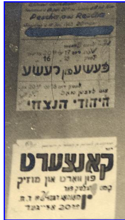
מודעות על מופעי תרבות בגטו וילנה