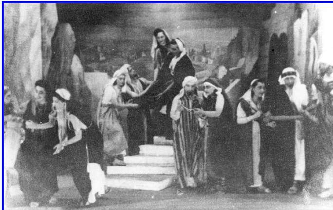
סצנה מתוך ההצגה "היהודי הנצחי" בגטו וילנה