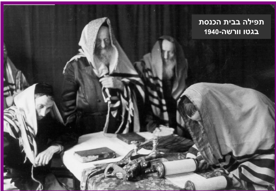
תפילה בבית הכנסת בגטו וורשה-1940